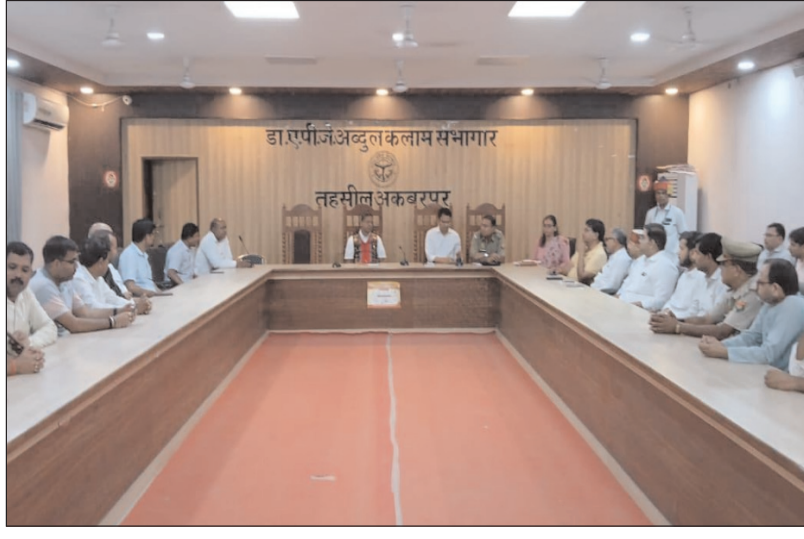
के अनुरूप आमजन की समस्याओं का पारदर्शी एवं निष्पक्ष समाधान किया जाना प्राथमिकता है और इसमें किसी प्रकार की देरी बर्दाश्त नहीं की जाएगी।

रसूलाबाद (कानपुर देहात), 16 मई: शनिवार को तहसील रसूलाबाद में आयोजित सम्पूर्ण समाधान दिवस में अधिकारियों ने फरियादियों की समस्याएं गंभीरता से सुनीं और उनके त्वरित निस्तारण के निर्देश दिए। समाधान दिवस में क्षेत्र के विभिन्न गांवों से पहुंचे लोगों ने भूमि विवाद, कब्जा, पेंशन एवं राशन कार्ड से जुड़ी समस्याएं अधिकारियों के समक्ष प्रस्तुत कीं। अधिकारियों ने संबंधित विभागों के कर्मचारियों को निर्देशित किया कि शिकायतों का प्राथमिकता के आधार पर निस्तारण किया जाए और किसी भी स्तर पर लापरवाही न बरती जाए। इस दौरान अधिकारियों ने कहा कि राजस्व और पुलिस विभाग आपसी समन्वय बनाकर कार्य करें, जिससे विशेष रूप से भूमि विवादों का शीघ्र समाधान हो सके। साथ ही आवश्यक मामलों में टीम बनाकर मौके पर जांच कर कार्रवाई करने के निर्देश दिए गए। अधिकारियों ने स्पष्ट किया कि शासन की मंशा