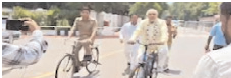
मॉर्निंग सिटी संवाददाता

अलीगढ़। पीएम नरेंद्र मोदी के ईंधन संरक्षण की अपील का असर जनप्रतिनिधियों, युनिवर्सिटी वीसी-रिजस्ट्रार के बड़े प्रशासनिक अधिकारियों पर भी दिखना शुरू हो गया है। अलीगढ़ के सिटी मजिस्ट्रेट साइकिल से अपने ऑफिस पहुंचे।