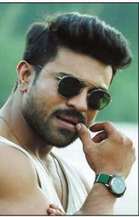
संजय लीला भंसाली की फिल्मों का दर्शकों को बेसब्री से इंतजार रहता है। कुछ समय पहले ऐसी खबर आई थी कि संजय लीला भंसाली की