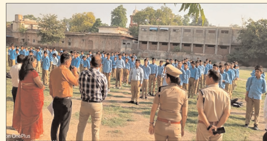
मॉर्निंग सिटी संवाददाता

अलीगढ़। उत्तर प्रदेश सरकार द्वारा संचालित व्यापक नशा मुक्ति अभियान के अंतर्गत शनिवार को नौरंगीलाल राजकीय इंटर कॉलेज में एक जागरूकता कार्यक्रम का आयोजन किया गया। कार्यक्रम के दौरान छात्र-छात्राओं को सामूहिक रूप से नशा मुक्ति की शपथ दिलाई गई, जिसमें बड़ी संख्या में विद्यार्थियों ने उत्साहपूर्वक सहभागिता की।