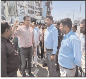
मोर्निंग सिटी संवाददाता