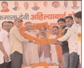
मोर्निंग सिटी संवाददाता

मैनपुरी। शनिवार को शहर में अहिल्याबाई होलकर की जयंती समारोह का आयोजन किया गया। जिसमें केन्द्रीय राज्यमंत्री प्रो. एसपी सिंह बघेल मुख्य अतिथि के रूप में शामिल हुए। उन्होंने समाज को शिक्षा के प्रति जागरूक किया और इसे सबसे मजबूत हथियार बताया। शहर के गोला बाजार स्थित अहिल्याबाई होलकर चौक पर पहुंचकर केन्द्रीय राज्यमंत्री प्रो. एसपी सिंह बघेल ने उनकी प्रतिमा पर माल्यार्पण किया। उन्होंने अपने