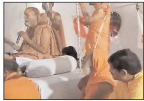
मोर्निंग सिटी संवाददाता

करहल पहुंचे शंकराचार्य ने भाजपा पर जमकर मिला बोला