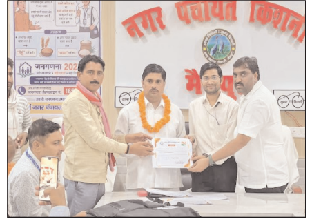
मोर्निंग सिटी संवाददाता

समय से कार्य पूर्ण करने पर दिया गया प्रशस्ति पत्र